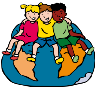
We horen bij elkaar